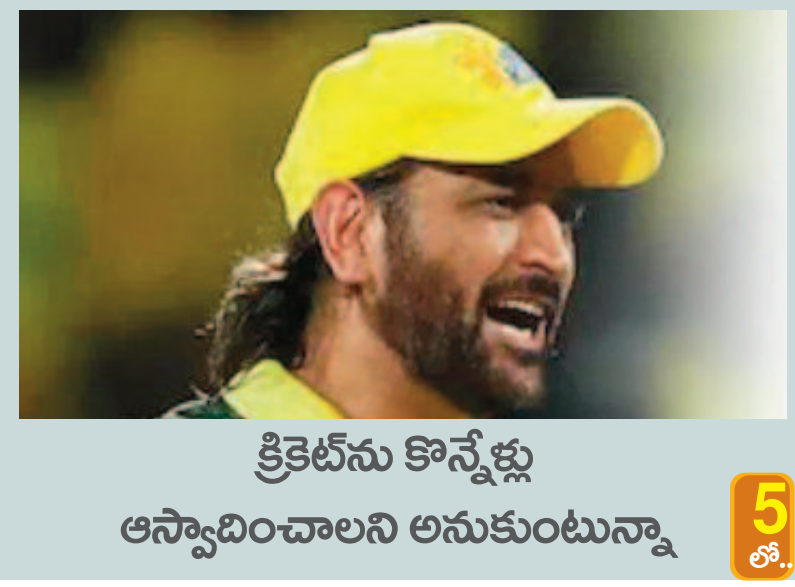
క్రికెట్ను కొన్నేళ్లు ఆస్వాదించాలని అనుకుంటున్నా