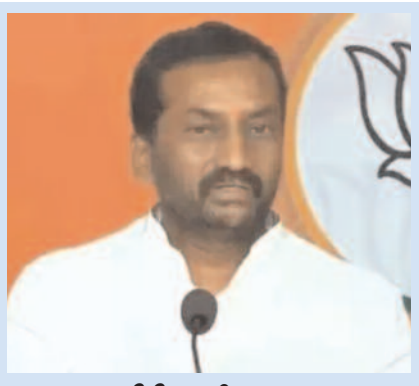
ఫాంహౌస్ సీసీ ఫుటేజీ బయటపెట్టాలి

హైదరాబాద్/గజ్వేల్, అక్టోబరు 27 : జన్మస్థానం ఫాంహౌస్ లో రేవ్ పార్టీపై సమగ్ర దర్యాప్తు జరిపించాలని కేంద్ర మంత్రి, బీజేపీ రాష్ట్ర అధ్యక్షుడు జి.కిషన్ రెడ్డి రాష్ట్ర ప్రభుత్వాన్ని డిమాండ్ చేశారు. ఫాంహౌస్ ఎవరిదైనా దర్యాప్తు జరపాల్సిందేనన్నారు. రాజకీయాలకు అతీతంగా దర్యాప్తు జరగాలని, చట్టాన్ని తనవనితాను చేసుకోని వ్యాలని ప్రభుత్వానికి సూచించారు. దొంగ వీడియోలు తీసి దేశవ్యాప్తంగా జడ్జిలకు పంపిన చరిత్ర ఉన్న బీఆర్ఎస్ కూడా ఇప్పుడు తమపై డ్రగ్స్ కేసులు అక్రమంగా పెడుతున్నారంటూ పెడబొబ్బలు పెడుతోందని కిషన్ రెడ్డి విమర్శించారు. కేసీఆర్ సీఎంగా ఉన్నప్పుడు ఫాంహౌస్ పైల్డ్ పేరిట ఐదు గంటల పాటు సినిమా చూపించారని గుర్తుచేశారు. నాడు కేసీఆర్ కుటుంబం రాష్ట్రాన్ని దోచుకోగా, ఇప్పుడు కాంగ్రెస్ నేతలు సామూహికంగా దోచుకుంటున్నారని, రాష్ట్రాన్ని భ్రష్టుపెట్టిస్తున్నారని దుయ్యబట్టారు. బీజేపీ రాష్ట్ర కార్యాలయంలో ఆదివారం కిషన్ రెడ్డి మీడియా సమావేశంలో మాట్లాడారు. గడిచిన పది నెలల్లో జరిగిన ఒప్పుందాలు, చేసిన అప్పులు, ఆస్తుల వివరాలతో మొత్తం ఆర్థిక పరిస్థితిపై రాష్ట్ర ప్రభుత్వం శ్వేతపత్రం విడుదల చేయాలని డిమాండ్ చేశారు. ఒక్క హామీని కూడా అమలు చేయలేని దుస్థితిలో ఉన్న ప్రభుత్వం, లక్షా యాభై వేల కోట్లతో మానీ ప్రక్షాళన చేపామంటూ ఎగిరెగిరి పడుతోందని దుయ్యబట్టారు. తెలంగాణకు కేంద్రం అన్యాయం చేసిందంటూ కేసీఆర్ పదేళ్లు మాట్లాడగా.. ఇప్పుడు సీఎం రేవంత్ కూడా అదే పల్లవి ఎత్తుకున్నారని కిషన్ రెడ్డి విమర్శించారు.