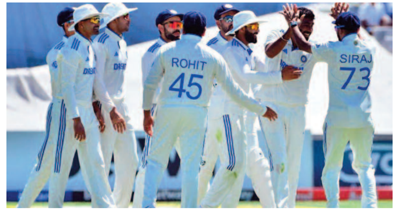
సిరీస్ను కైవసం చేసుకుంటేనే భారత్ ఫైనల్కు చేరుకుంటుంది

ఎడిటర్: దూసరి రవీందర్ గౌడ్ బుధవారం 6 నవంబర్ 2024 సంపుటి : 12 సంచిక : 290 పేజీలు : 8 వెల : 4/-