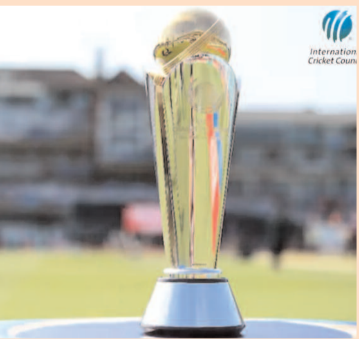
ఉన్నామని తెలిపారు. తొలుత షెడ్యూల్ చేసిన ప్రకారం భారత్ బంగ్లాదేశ్తో ఫిబ్రవరి 20న, న్యూజిలాండ్తో 23న, పాకిస్తాన్ మార్చి 1న తలపడాల్సి ఉంది. ఈ మూడు మ్యాచ్లకు లాహోర్ను వేదికగా ఎంచుకున్నారు.

పాకిస్తాన్ వేదికగా వచ్చే ఏడాది జరగనున్న ఛాంపియన్స్ ట్రోఫీలో భాగంగా లాహోర్లో నేడు(సోమవారం) జరగాల్సిన కార్యక్రమాన్ని ఐసీసీ రద్దు చేసింది. టోర్నమెంట్ షెడ్యూల్ విషయంలో ఏకాభిప్రాయం రాకపోవడం, ఇండియా పాకిస్తాన్ పర్యటనకు నో చెప్పడంతో 8 జట్లు పాల్గొనే టోర్నమెంట్ నిర్వహణలో సందిగ్ధం నెలకొంది. వచ్చే ఏడాది ఫిబ్రవరి 19 నుంచి మార్చి 19 వరకు ఈ టోర్నీ జరగాల్సి ఉంది. నేడు(సోమవారం) జరగాల్సిన షెడ్యూల్ రివీజ్, వంద రోజుల కౌంట డౌన్ ఈవెంట్ రద్దయింది. భారత్ పాకిస్తాన్లో పర్యటనకు 'నో చెప్పడంతో' షెడ్యూల్ అంశమై పాకిస్తాన్, టోర్నీలో పాల్గొనే జట్లతో చర్చిస్తున్నట్లు ఐసీసీ వర్గాలు తెలిపాయి. 'షెడ్యూల్ ఇంకా కన్ఫర్మ్ కాలేదు. ఆతిథ్య జట్టు, టోర్నీలో పాల్గొనే దేశాలతో షెడ్యూల్ గురించి మాట్లాడుతున్నాం. చర్చలు ముగిసిన తర్వాత షెడ్యూల్ ఎప్పుడు అన్నది వెల్లడిస్తామని ఐసీసీ అధికారి తెలిపారు. లాహోర్లో దట్టమైన పొగమంచు, భారత్ పాక్ పర్యటనకు 'నో' చెప్పడం వంటి అంశాలతో ఈవెంట్ రద్దయినట్లు తెలుస్తోంది. పీసీబీ చైర్మన్ మోసిన నఖ్వీ మాట్లాడుతూ.. భారత్ ఈ అంశమై ఎలాంటి రాతపూర్వక లేఖ ఇవ్వలేదన్నారు. హైబ్రిడ్ మోడల్ గురించి మాట్లాడేందుకు సిద్ధంగా