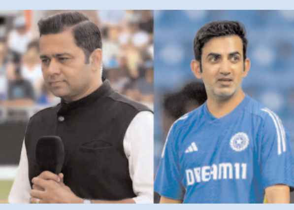
ఓడిపోయింది. దీంతో గౌతం గంభీర్పై విమర్శలు వెల్లువెత్తాయి. తాజా ఓ హిందీ పత్రిక టోర్నీ-గావస్కర్ ట్రోఫీలో భారత్ ఓటమి పాలైతే.. గంభీర్ను టెస్ట్ జట్టు కోచ్ గా తొలగిస్తారని పేర్కొంది. ప్రస్తుత నేషనల్ క్రీకెట్ అకాడమీ హెడ్ వీవీఎస్ లక్ష్మణ్కు ఆ బాధ్యత అప్పగిస్తారని పేర్కొంది. ప్రస్తుతం అతడు దక్షిణాఫ్రికా పర్యటనలో ఉన్న టీ20 జట్టుకు స్టాండ్ ఇన్ కోచ్ గా వ్యవహరిస్తున్నాడు.

ఆస్ట్రేలియా పర్యటనలో భారత జట్టు విఫలమైతే బీసీసీఐ జట్టుకు ఫార్మాట్లను బట్టి కోచ్లను నియమిస్తుందనే ప్రచారం జోరందుకొంది. దీనిపై మాజీ క్రీకెటర్ ఆకాశ్ చాప్రా స్పందించాడు. అతడు తన యూట్యూబ్ ఛానెల్లో మాట్లాడుతూ " టోర్నీ-గావస్కర్ ట్రోఫీలో భారత్ జట్టు విఫలమైతే కోచ్ గౌతం గంభీర్ (%+బుబ్బు+బుబ్బు-ప్రతి%)ను మార్చేస్తారని ప్రచారం జరుగుతోంది. అది పూర్తిగా పుకారే అని నేను అనుకుంటున్నాను. ఫార్మాట్ల ఆధారంగా కోచ్లను నియమిస్తారని చెప్పడం తొందరపాటి అవుతుంది. తప్పుడు ఉద్దేశాలతోనే ఇలాంటి ప్రచారాలు చేపడతారు. గంభీర్ హెడ్ కోచ్ గా ఇప్పుడే బాధ్యతలు చేపట్టాడు. అలాంటప్పుడు ఆటగాళ్లు బాగా ఆడకపోతే కోచ్ తొలగించడం అనే జరగదు. అది పద్ధతి కాదు. గంభీర్ అడిగినవి మొత్తం బీసీసీఐ సమకూర్చించింది. గతంలో అతడి జట్టుకు భారతీయ కోచ్లు ఉండాలని చెప్పాడు. కానీ, తాను మాత్రం రేయాన్, మెర్సెల్స్ అడిగాడు. యాజమాన్యం అంగీకరించింది. శ్రీలంక సిరీస్కు సీనియర్లను అడిగాడు.. బీసీసీఐ ఓకే అంది. పిచ్ల తయారీలో కూడా స్వేచ్ఛను ఇచ్చింది. ఇంత జరిగాక గంభీర్ కచ్చితంగా ఫలితాలకు బాధ్యత తీసుకోవాల్సి ఉంటుంది" అని పేర్కొన్నాడు. ఇటీవల న్యూజిలాండ్తో టెస్ట్ సిరీస్ను భారత్