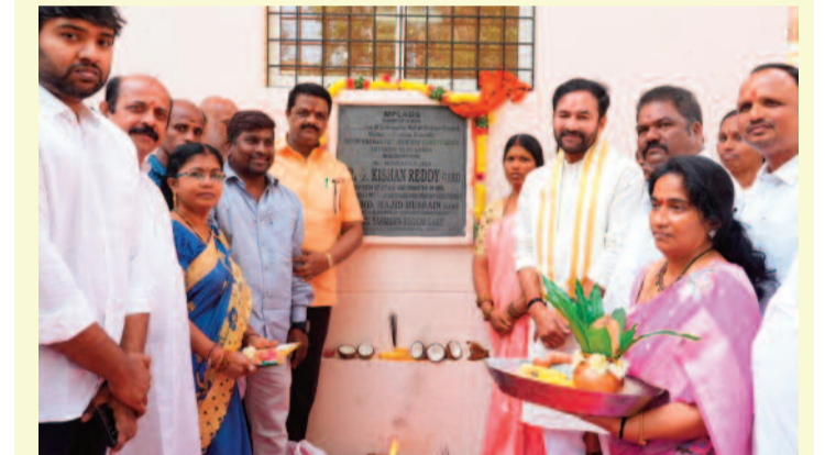
హైదరాబాద్, నవంబర్ 10: ఏండ్లుగా నాంపల్లి నియోజకవర్గంలో మజ్జిన్ నేతలు ప్రజాప్రతినిధులుగా ఉండి ప్రజలను మోసం చేస్తున్నారని కేంద్ర మంత్రి కిషన్ రెడ్డి మండిపడ్డారు. అనేక ఏండ్లుగా ఈ ప్రాంతంలో ఎమ్మెల్యేలుగా, కార్పొరేటర్లుగా, మజ్జిన్ పార్టీ నేతృత్వం వహిస్తున్నదని, హిందూ బెల్ట్ ప్రాంతాల్లో ప్రభుత్వం నుంచి ఎటువంటి నహకారం కూడా ప్రజలకు అందకుండా అడ్డుకునే ప్రయత్నం చేస్తున్నారని కిషన్ రెడ్డి