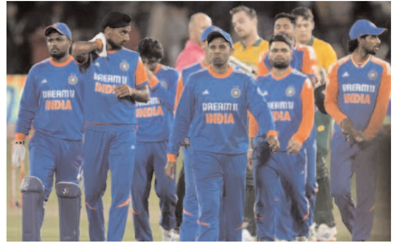
పోరాడి ఓడిన భారత్

ఎడిటర్: దూసరి రవీందర్ గౌడ్ సోమవారం 11 నవంబర్ 2024 సంపుటి : 12 సంచిక : 295 పేజీలు : 8 వెల : 4/-