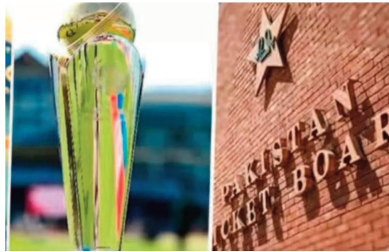
పాక్కు షాక్ ఇచ్చిన ఐసీసీ..