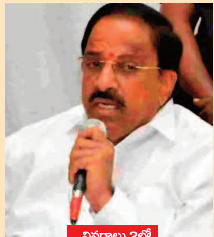
.. వివరాలు 2లో