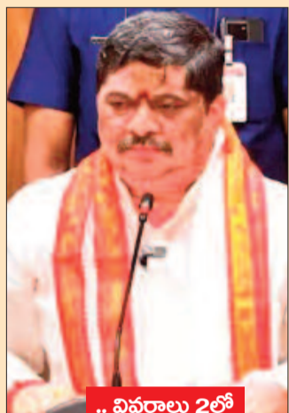
.. వివరాలు 2లో