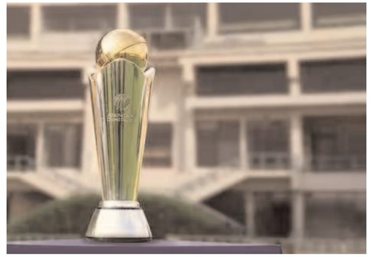
ఛాంపియన్స్ ట్రోఫీ టూర్ షెడ్యూల్ మార్పు