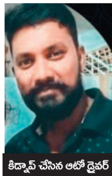
నా భార్య పిల్లల కనిపిస్తే చెప్పండి క్షీణ్!