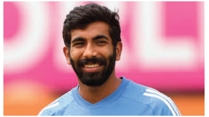
తొలి టెస్టుకు రోహిత్ దూరం! కెప్టెన్ గా బువ్రూ..

ఎడిటర్: దూసరి రవీందర్ గౌడ్ సోమవారం 18 నవంబర్ 2024 సంపుటి : 12 సంచిక : 302 పేజీలు : 8 వెల : 4/-