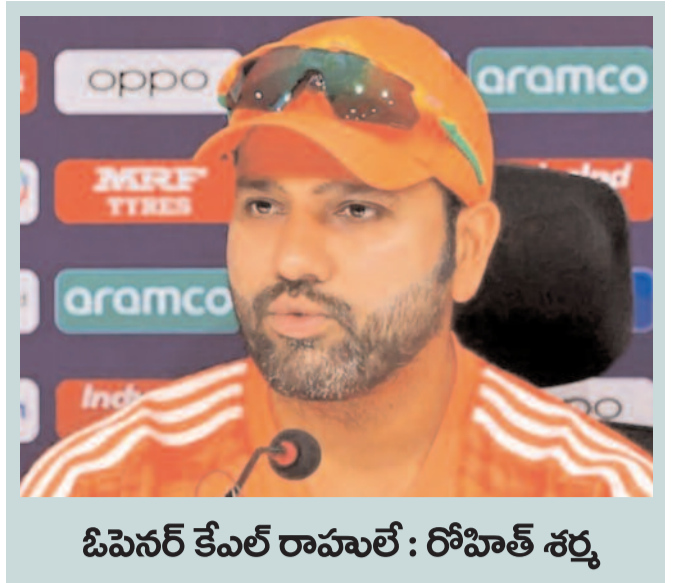
ఓపెనర్ కేఎల్ రాహుల్ : రోహిత్ శర్మ