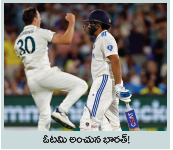
ఓటమి అంచున భారత్!