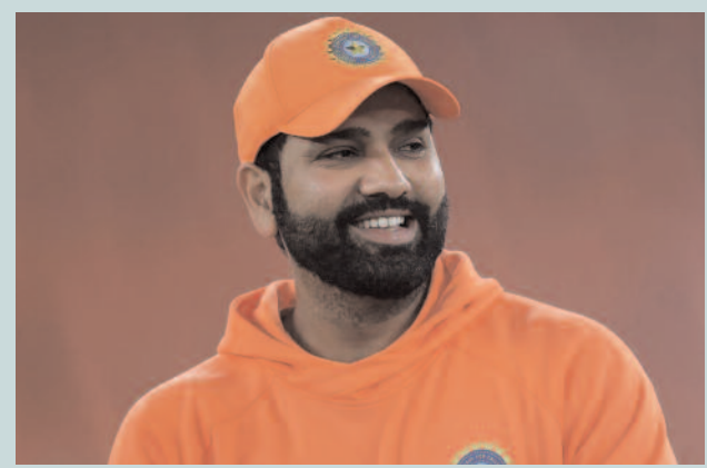
రోహిత్ శర్మను ఓపెనర్ గా ఆడించే అవకాశం