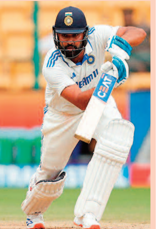
విదేశాల్లో మాత్రం 33 సగటు మాత్రమే నమోదు చేశాడు. ఇప్పటికే టీ20 ఫార్మాట్ కు వీడ్కోలు పలికిన రోహిత్ శర్మ.. టెస్ట్, వన్డే ఫార్మాట్ లోనే కొనసాగుతున్నాడు. టీ20 ప్రపంచకప్ 2024 విజయానంతరం పొట్టి ఫార్మాట్ కు గుడ్ బై చెబుతున్నట్లు రోహిత్ శర్మ ప్రకటించాడు. ఛాంపియన్స్ ట్రోఫీ 2025 అనంతరం వన్డే ఫార్మాట్ కు వీడ్కోలు పలికే అవకాశం ఉన్నట్లు కూడా ప్రచారం జరుగుతోంది. డబ్బుల్ టెస్ట్ సైరల్ తర్వాత సుదీర్ఘ ఫార్మాట్ కు కూడా రోహిత్ రిటైర్మెంట్ ప్రకటిస్తాడని ప్రచారం జరిగింది. భారత్ పైనల్ చేరే అవకాశాలు కనిపించడం లేదు. బోర్డర్ గవాస్కర్ ట్రోఫీని గెలిపిస్తే భారత్ కు డబ్బుల్ టెస్ట్ సైరల్ డక్కనుంది. ఇప్పటికే రోహిత్ శర్మ రిటైర్మెంట్ ప్రకటించాలంటూ నెటిజన్లు డిమాండ్ చేస్తున్నారు.