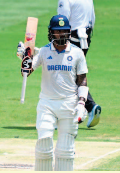
ఆస్ట్రేలియా రెండో ఇన్నింగ్స్ ఆడాల్సింది. చివరి రోజు ఇండియన్ టీమ్ చివరి వికెట్ ను త్వరగా తీసి.. ఆ తర్వాత రెండో ఇన్నింగ్స్ లో వేగంగా పరుగులు చేసి రోహిత్ సేనకు కంగారూలు సవాలు విసురుతారా. లేక మ్యాచ్ డ్రా కోసమే ఆడతారా అన్నది చూడాలి. చివరి రోజు వర్షం ఆటంకం కలిగించకపోతే మాత్రం ఈ మ్యాచ్ లో ఫలితం కోసం ఆస్ట్రేలియా కచ్చితంగా ప్రయత్నిస్తుందనడంలో సందేహం లేదు.

చేసిన పోరాటం అసామాన్యం అని చెప్పొచ్చు. వర్షం వల్ల తరచూ అంతరాయాలు కలుగుతున్న ఈ టెస్టులో టీమిండియాను కచ్చితంగా ఫాలో ఆన్ ఆడిన్స్ గెలవచ్చని ఆస్ట్రేలియా భావించింది. కానీ బుర్రూ, ఆకాష్ దీప్ జోడి ఆ అవకాశం ఇవ్వలేదు. ఊహకందని రీతిలో ఆసీస్ బౌలర్లను సమర్థంగా ఎదుర్కొన్న ఈ ఇద్దరూ చివరి వికెట్ కు ఇప్పటికే 39 పరుగులు జోడించారు. ఇందులో ఆకాష్ దీప్ చేసిన పరుగులే 27 కావడం విశేషం. అందులో రెండు ఫోర్లు, ఒక సిక్స్ ఉన్నాయి. బుర్రూ కూడా 10 పరుగులతో అజేయంగా ఉన్నాడు. వీరిద్దరూ వికెట్ కాపాడుకోవడంతో ఫాలో ఆన్ గండం గట్టెక్కిడానికి కావాల్సిన 246 పరుగుల మార్క్ ను టీమిండియా అందుకుంది. ఆ సార్లు దాటగానే ఆకాష్ దీప్ ఓ భారీ సిక్స్ కూడా కొట్టాడు. ఆ సమయంలో వెలుతురు సరిగా లేదంటూ ఆటను నిలిపేశారు. దీంతో నాలుగో రోజు ముగిసే సమయానికి ఇండియన్ టీమ్ తొలి ఇన్నింగ్స్ లో 9 వికెట్లకు 252 రన్స్ చేసింది. ఇంకా 193 పరుగులు వెనుకబడి ఉంది. బ్రెస్టన్ టెస్ట్ ఇక డ్రా అవడం ఖాయంగా కనిపిస్తోంది. ఇప్పటికే ఈ టెస్టు తొలి రోజు ఆట 90 శాతానికిపైగా తుడిచిపెట్టుకుపోయింది. తర్వాతి మూడు రోజులు కూడా వరుణుడు తరుచూ అడ్డుపడుతూనే ఉన్నాడు. దీంతో నాలుగు రోజులు కలిపి కేవలం 191 ఓవర్లు మాత్రమే సాధ్యమయ్యాయి. చివరి రోజు కూడా వర్షం పడే అవకాశాలు ఉన్నాయి. దీనికోసం టీమిండియా ఫాలో ఆన్ తప్పించుకోవడంతో