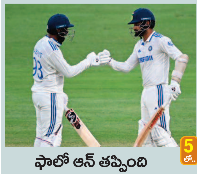
ఫాలో ఆన్ తప్పింది